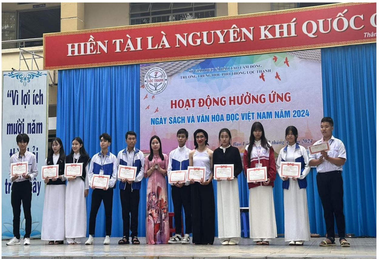
CĐCS TRƯỜNG THPT LỘC THẠNH - BẢO LỘC