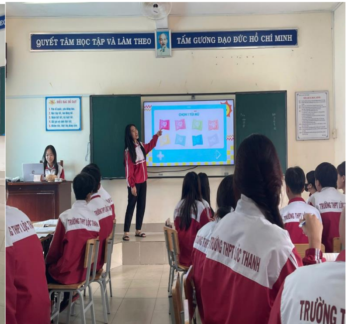
Một số hình ảnh học sinh lớp 11A4 thực hiện hoạt động thảo luận nhóm, trao đổi và thực hiện chủ đề thuyết trình trong tiết học bài Chiều Cầu Hiền, Ngữ Văn 11.