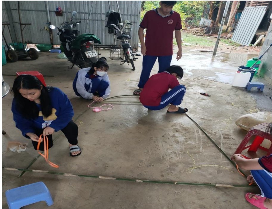
Lớp 10A4 đang thiết kế công Parabol làm từ tre