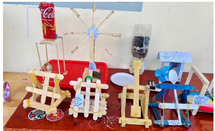
Các sản phẩm của lớp 10A2