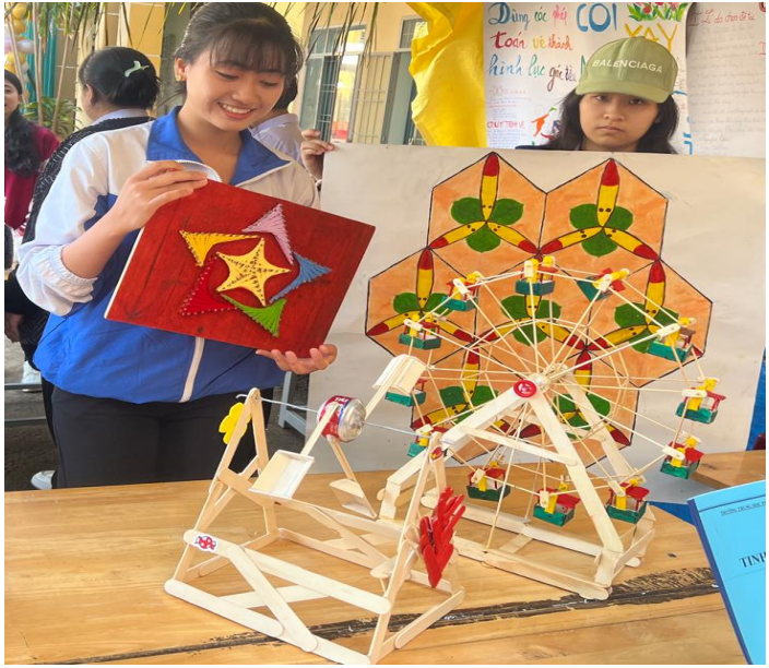
Các sản phẩm của lớp 11A7