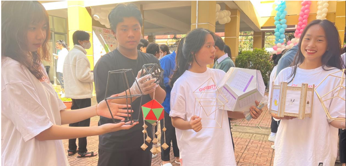
Các sản phẩm của lớp 12A2