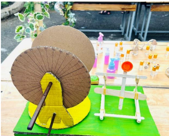
Thước đo góc và máy bắn đá của lớp 10A1