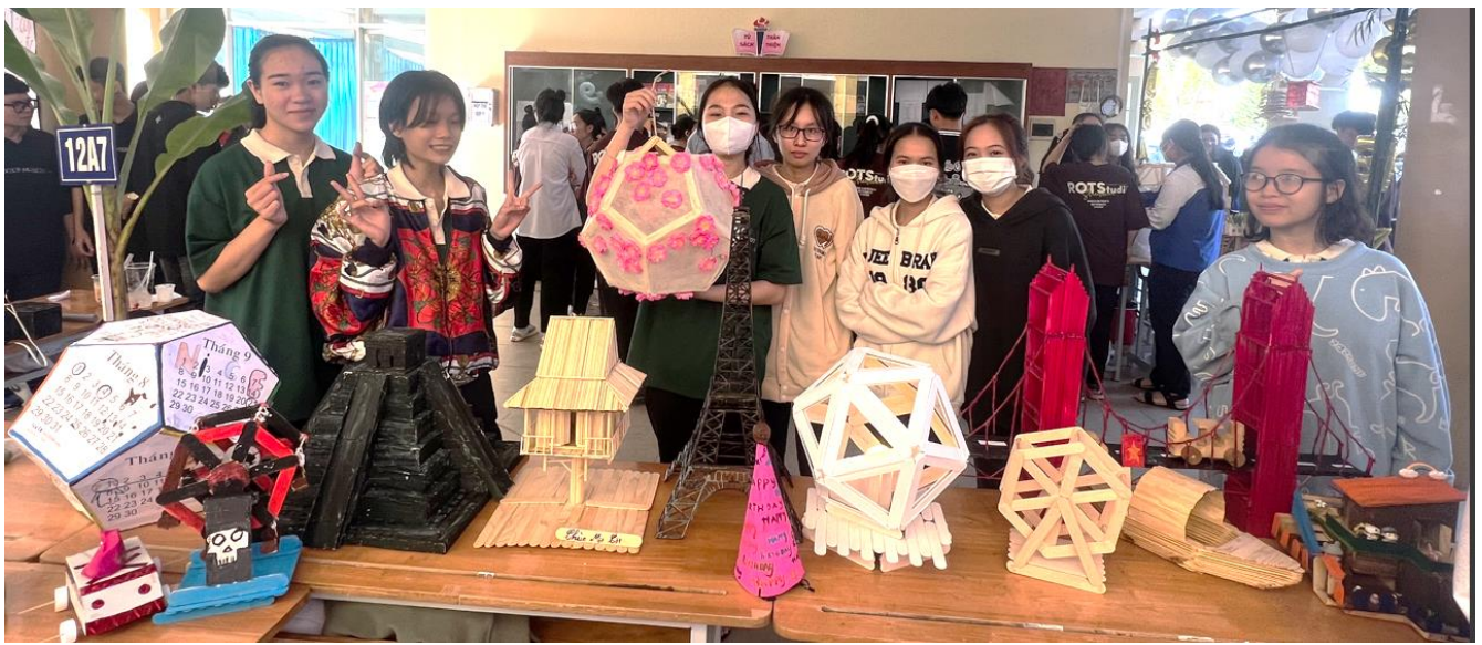
Các sản phẩm của lớp 12a7