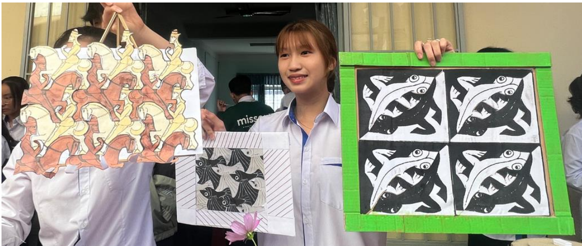
Các sản phẩm của lớp 11A9