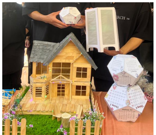
Các sản phẩm của lớp 12A6