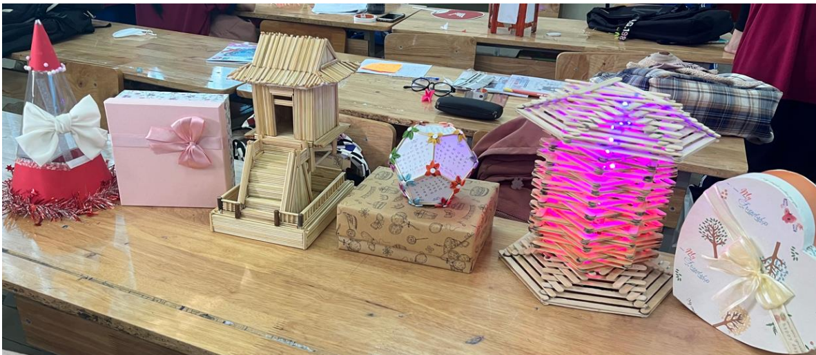
Các sản phẩm của lớp 11a2