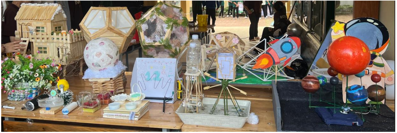
Các sản phẩm của lớp 12a8