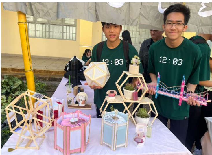
Các sản phẩm của lớp 12A3