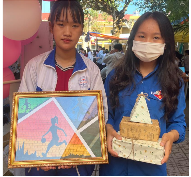
Các sản phẩm của lớp 11A8