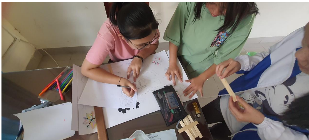
Lớp 11A3 đang vẽ các bức tranh bằng cách vận dụng phép biến hình

Một số hình ảnh hậu trường, thực hiện sản phẩm của học sinh.