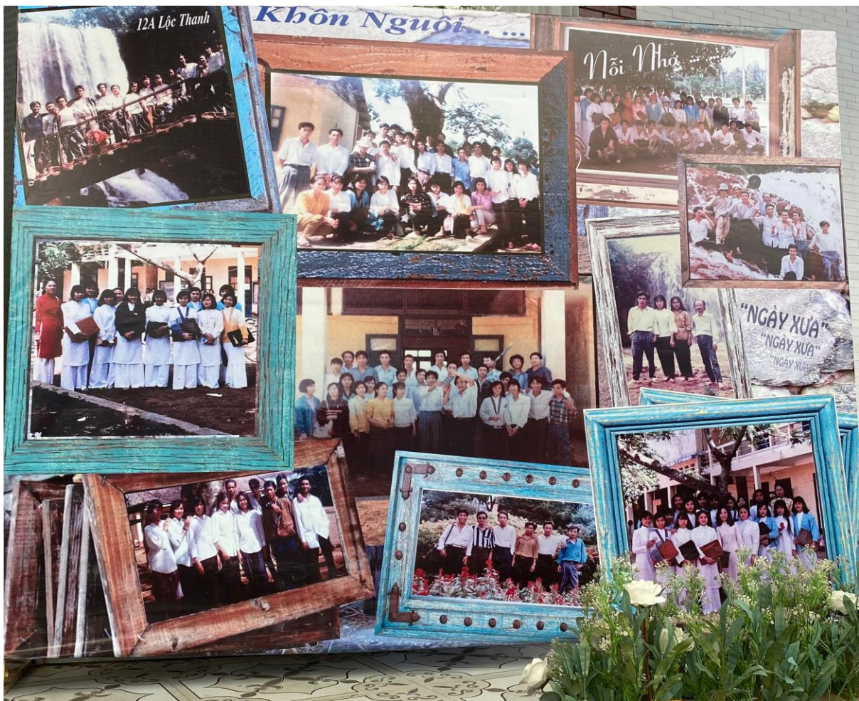
Cùng ngắm lại những gương mặt hồn nhiên, đáng yêu...pha chút ngây ngô 30 năm về trước