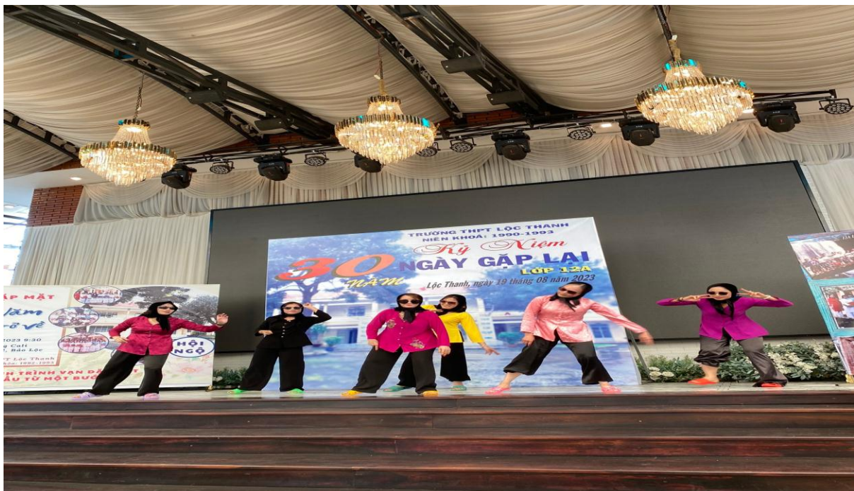
Cựu HS góp vui bằng tiết mục văn nghệ...siêu dễ thương