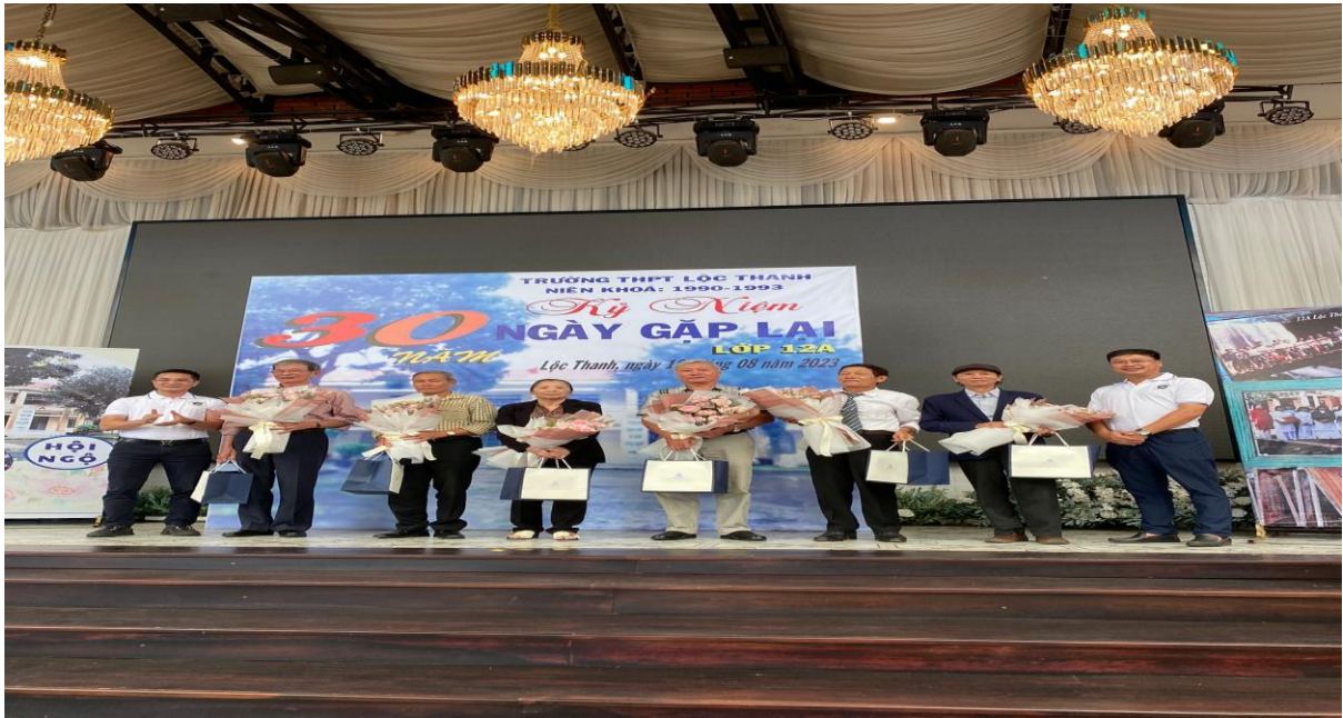
Các thầy cô giáo cũ của khóa 1990 – 1993 về chung vui với các trò

Thay mặt các bạn học sinh, ban liên lạc hội khóa bày tỏ lòng biết ơn sâu sắc đến nhà trường và toàn thể các thầy, cô giáo - những người đã dạy dỗ, dìu dắt các thế hệ học trò trong suốt những năm qua bằng những bó hoa tươi thắm và những phần quà tri ân